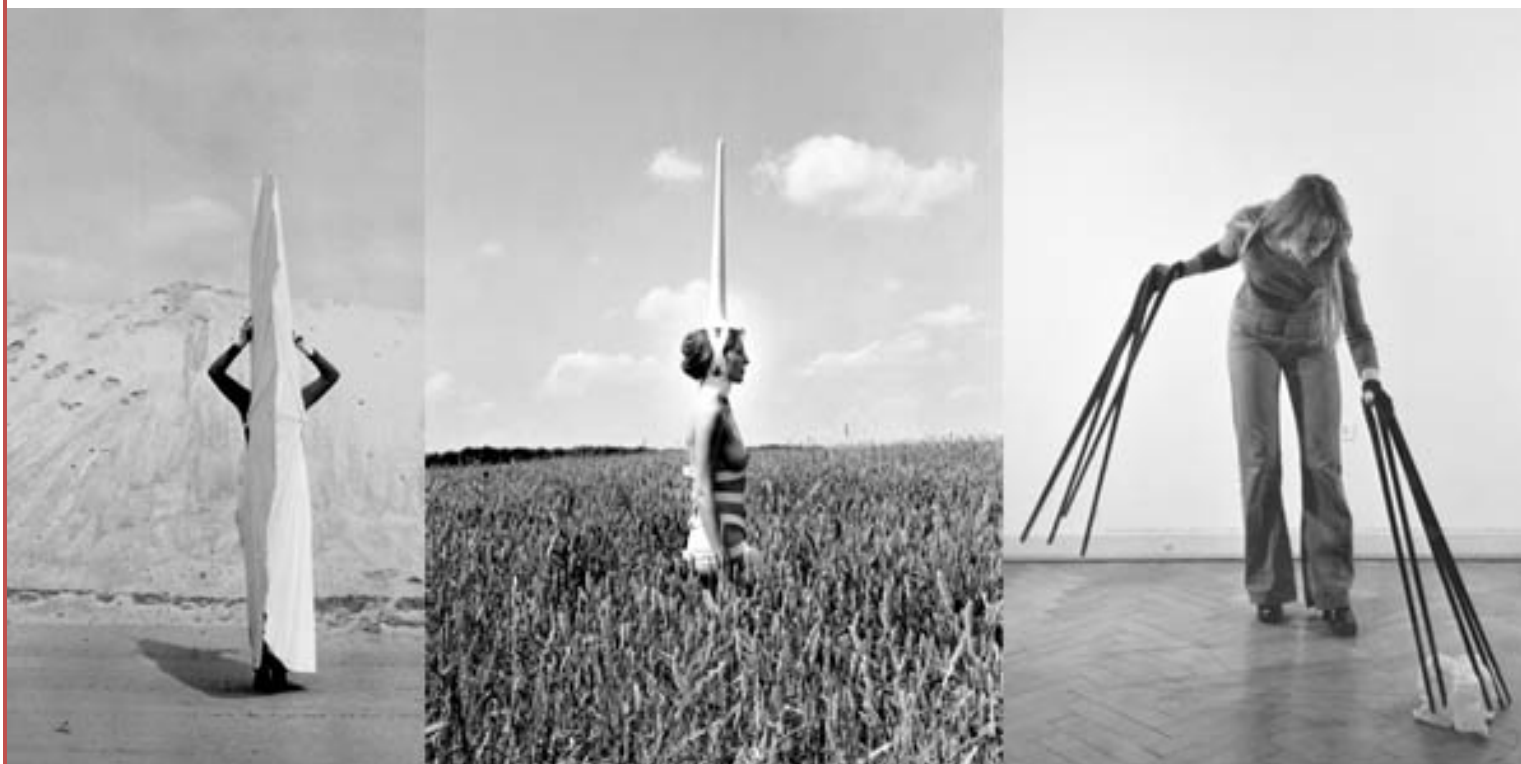
Rebeca Horn, corn field Uni 1998